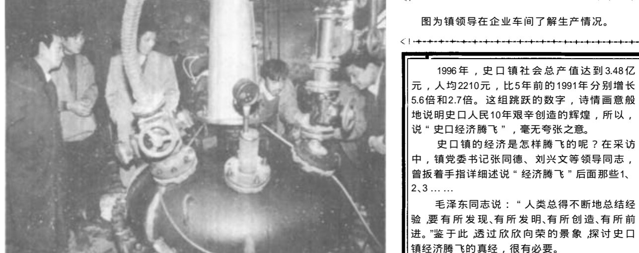
图为镇领导在企业车间了解生产情况。

九六年以来，史口镇乡镇企业又有新的突破，呈现出良好的发展势头。到去年底，史口镇集体企业26处，完成总产值2.848亿元，比去年增长38.9%，占全镇社会总产值的82.59%，镇办企业完成总产值6500万元，村办企业完成总产值4480万元，村以下个体办企业完成总产值1.75亿元，分别比去年增长7.9%、49.3%和52.44%。工业企业完成总产值6440万元，比去年增长39.39%。 首先，他们分析形势，立足优势，调整思路。结合实际，及时调整乡镇发展思路，提出了“巩固提高劳务企业稳基础，重点发展工业抓强项，开展乡镇企业的第二次创业”的口号，确立了新的发展思路和目标。第二，解放思想，提高认识。一是统一了党委政府“一班人”的思想，强化了“小政府大服务”的意识，二是克服了企业干部“小富既满，小成既安”的思想，跳出小圈子，走向大市场，树立干大事、创大业、挣大钱的新思想；三是提高了村干部对“以工补农”的认识，帮助扶持他们积极发展村办企业，壮大集体经济。第三，强化管理，突出重点，调整产业结构。去年，他们按照新的发展思路，加快了由劳务企业向工业企业迈进的步伐。一是强化企业管理，注重内部挖潜，稳固提高现有劳务企业。改变以往以产值论英雄的倾向，坚持内涵外延并重，速度效益并举，对镇办企业以现场管理为突破口，加强了财务管理和质量管理，镇村劳