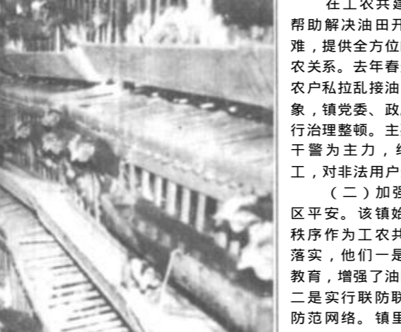
图为该镇三村养鸡场一角。

在工农共建工作中，他们积极帮助解决油田开发建设中遇到的困难，提供全方位的服务，妥善处理工农关系。去年春天，针对油区内部分农户私拉乱接油田“电、气、水”现象，镇党委、政府采取有效措施，进行治理整顿。主要领导挂帅，以政法干警为主力，组织120多名干部职工，对非法用户进行了清除治理。 (二)加强综合治理，确保油区平安。该镇始终把维护油区治安秩序作为工农共建的重要工作抓好落实，他们一是广泛开展法制宣传教育，增强了油区群众的法制观念。二是实行联防联治，建立健全治安防范网络。镇里成立了20多人的巡