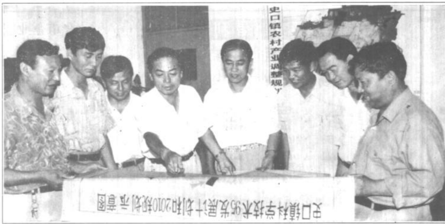
图为史口镇党政“一班人”在研讨“九五”科技发展规划。

镇共有镇村集体企业23家，个体私营企业2120家。去年完成总产值1.75亿元，实现利税1900多万元。 基础设施建设日新月异。全镇水、电、路、讯等基础设施日趋完善，村村通水、通电、通路、通电话。全镇乡村公路总长达26.7公里，全镇新建扩建水库5座。日益完善的基础设施为经济发展和各项事业进步提供了方便条件，投资环境得到优化。 社会主义精神文明建设成果显著。在大力发展经济的同时，我们始终坚持以“两手抓、两手硬”的方针，把精神文明建设当作大事来抓，为经济建设创造了良好的社会环境。广大干部群众的思想觉悟、整体素质不断提高，精神风貌焕然一新。全镇文化、教育、科技、社会治安综合治理等工作均达到先进乡镇标准；医疗保健、养老保险、计划生育等各项社会事业走在了全区的前列。 1997年，我们史口镇将以调整农业产业结构、加快农村奔小康步伐为重点，团结奋进，努力开拓，实现农业产业化、企业规模化，力争实现社会总产值4.23亿元，农民人均纯收入达到2500元。为此，我们一是加快实施农业产业化战略，大力调整农业产业结构，围绕粮棉、蔬菜、莲藕、养殖等主导产业，重点抓好科技兴农，和农业基础设施建设等工作；二是强化工业强镇意识，继续抓好骨干项目建设和龙头企业培育，围绕市场，发挥优势，全面振兴乡镇企业。三是加强党的建设，推动社会主义精神文明再上新台阶。积极开展“学、比、用”和“双群”“手拉手”共同致富活动，全面实施帮带工程，切实加强农村基层组织和党支部建设。大力开展群众性的精神文明创建活动，努力建设文明富裕的史口镇。