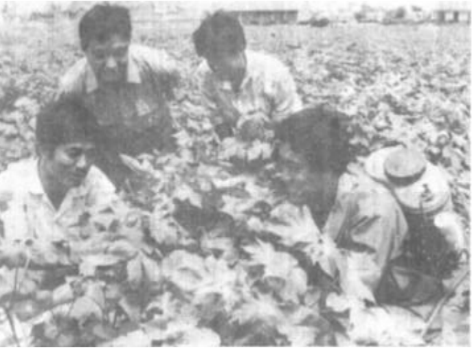
镇领导和农技人员经常深入田间指导棉农科学治虫。