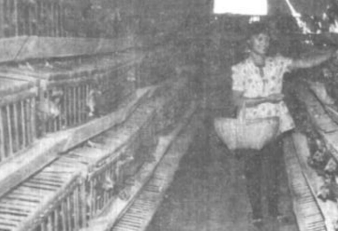
图为该镇三村养鸡场一角。

史口镇在社会治安综合治理工作中，突出油区治安这个重中之重，全方位地开展工作，使全镇的社会风气、社会治安状况进一步好转，人民群众的安全感进一步增强，出现了政通人和、百业俱兴的大好局面。 一、提高认识，强化领导，舍得花钱买平安。镇党委、政府真正做到了“两手抓，两手都要硬”，在搞好全镇经济建设的同时，承担起了保一方平安的政治责任。一年来，镇党委召开社会治安综合治理专题会议13次，共制定方案7个。除舍得拿时间花精力之外，党委、政府“一班人”还舍得花钱买平安。在镇财政十分紧张的情况下，花1.5万元为司法所购置了三轮摩托车一辆；花7万元为综治办更换了车辆；投入2.7万元为巡逻队配备了服装及日用品；拿出1.5万元表彰了社会治安综合治理及“二五”普法先进集体和个人；在“严打”期间，拿出2万元专款支持“严打”斗争。在去年投入50多万元的基础上，今年又对政法各部门累计投入近20万元。增强了治安控制能力。 二、突出两个重点，唱好“坚持严打斗争”和“强化油区治安”两场社会治安综合治理重头戏。在打击刑事犯罪活动中，镇党委主要领导坐镇指挥，并到一线慰问干警，分管领导亲自上阵，参战干警风雨无阻，连续作战，对各类犯罪分子开展大规模的围剿，取得显著成效。 三、认真贯彻落实“综治”方针，做到常抓不懈。他们根据“谁主管，谁负责”的原则，镇委与38个村，17个企事业单位，镇综治委与各成员单位，镇企管委与各镇办企业、镇教委与各中小学，各村与村办企业等层层签定了社会治安综合治理责任书。同时，他们积极抓好群防群治。去年以来，村级巡逻组织配合镇巡逻队共抓获各类违法人员30余名，缴获油气管8吨、截获原油10多吨、缴获电缆线110多米，为油田挽回直接经济损失10万余元。现全镇共有帮教对象29人，通过法制教育和个人学习等形式，促使转变明显好转的占80%，一般好转的占20%，无一人重复犯罪。